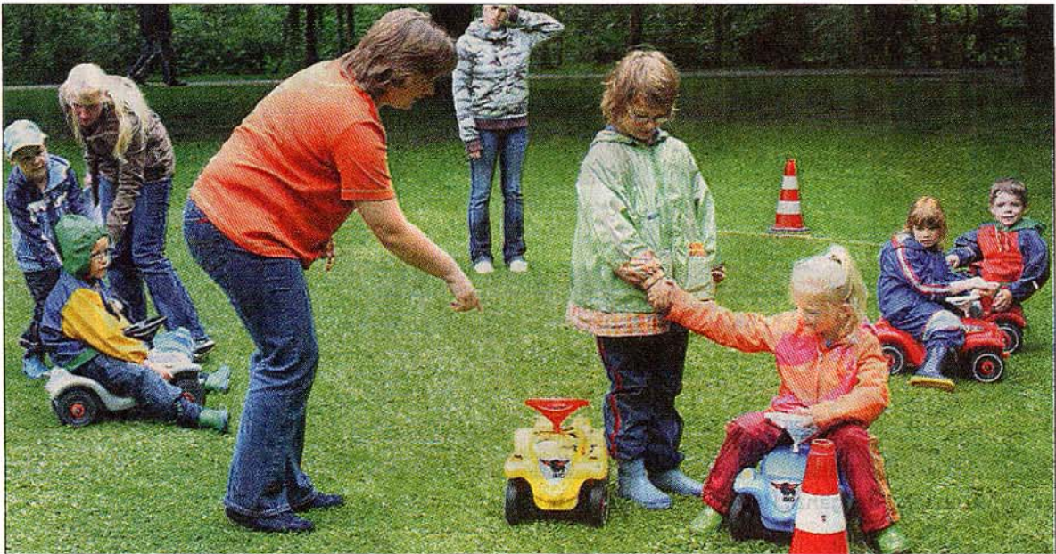
Der Sprachheilkindergarten verfolgt ein ganzheitliches Konzept in der Arbeit mit den Kindern.